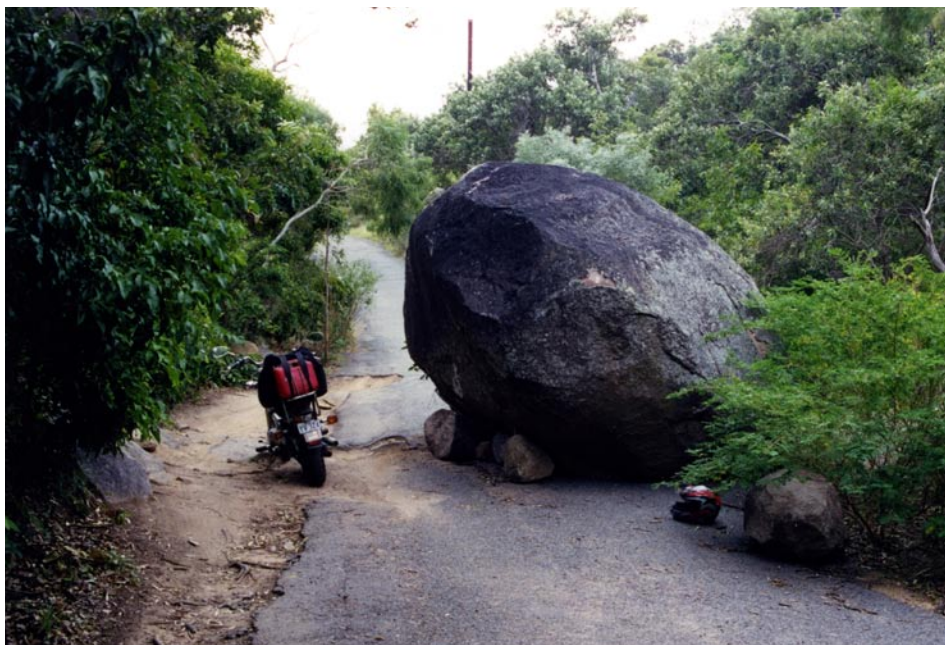
Stor sten på vejen på Magnetic Island.

indenbords. Det værste var dog, at der snart ikke var mere benzin tilbage i den lille tank. Jeg kunne lige forestille mig, at jeg skulle til at gå de sidste kilometer i silende regn. Langt om længe dukkede byskiltet med Strahan heldigvis op, og på hostelet var der en brændeovn, så den og jeg blev hurtigt gode venner.