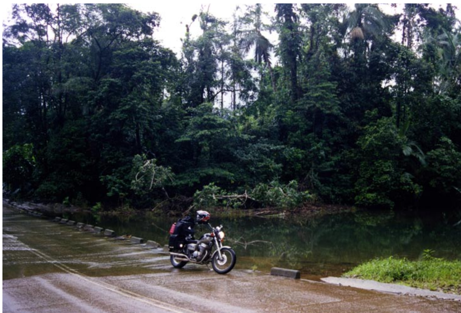
Vejen mod Cape Tribulation. Der er krokodiller i floden.

meste af dagen i Eungella National Park. Det var slet ikke nogen dårlig idé, for jeg var så heldig at se et næbdyr, platapus. Normalt er de kun fremme om morgenen og om aftenen. Jeg så den midt på dagen. Kun i nogle få sekunder, men den var der. Ikke mange australiere har set dem i fri natur. Der var også skildpadder og masser af specielle fugle.