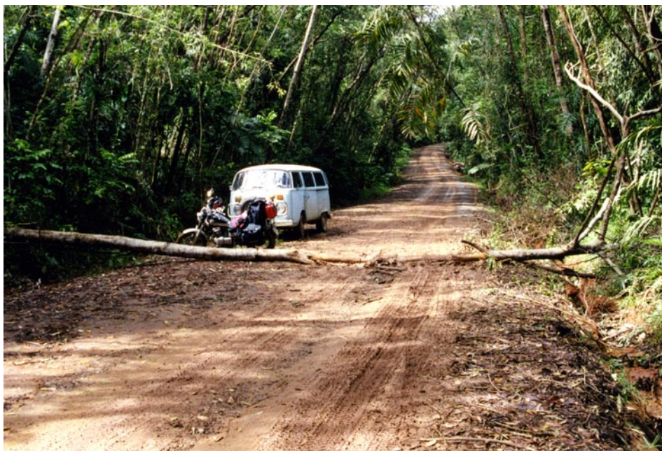
Jordvej med forhindring.

fortalte, at vejene var nogenlunde, og vejret ville være mildt med kun nogle få byger. Det var trods alt regnskov, jeg var omgivet af. Om aftenen var der en konkurrence med limbodans. Jeg syntes, det var vildt fedt, for jeg blev nummer et og modtog en flaske champagne. Så får man pludselig masser af venner!