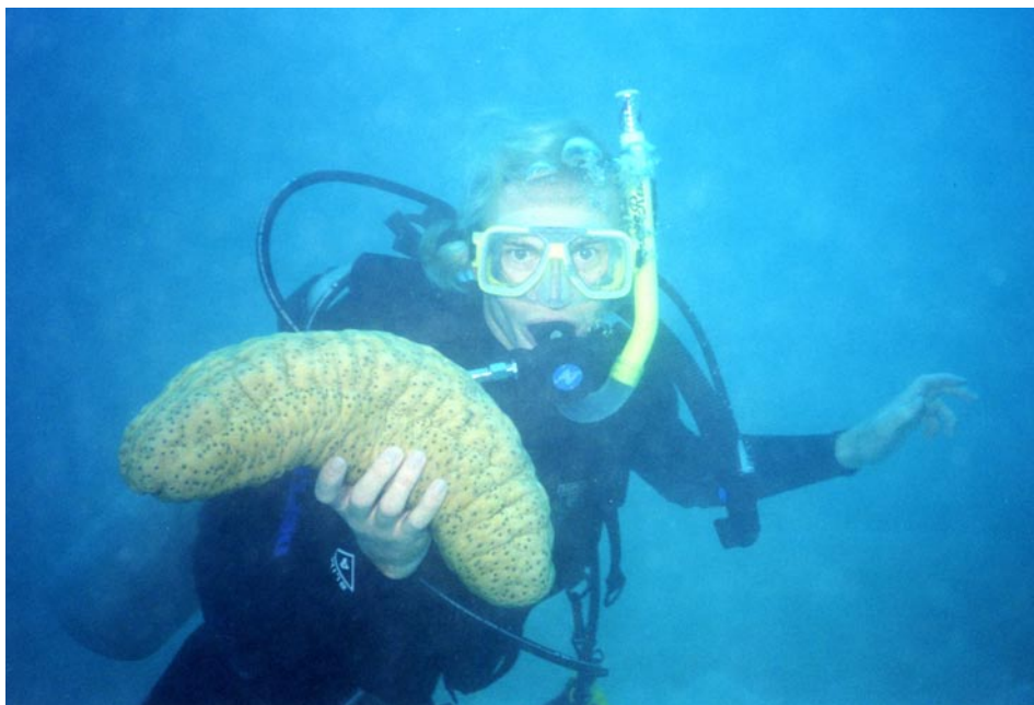
Dykning ud for Cairns.

og koblingskablet hang kun i nogle få tråde, så det blev også skiftet. Hvis man er til teknisk underholdning kan man besøge science- og teknikmuseet, hvor der er 4-5 etager med ting og sager, man kan prøve. Lidt i stil med Eksperimentariet herhjemme.