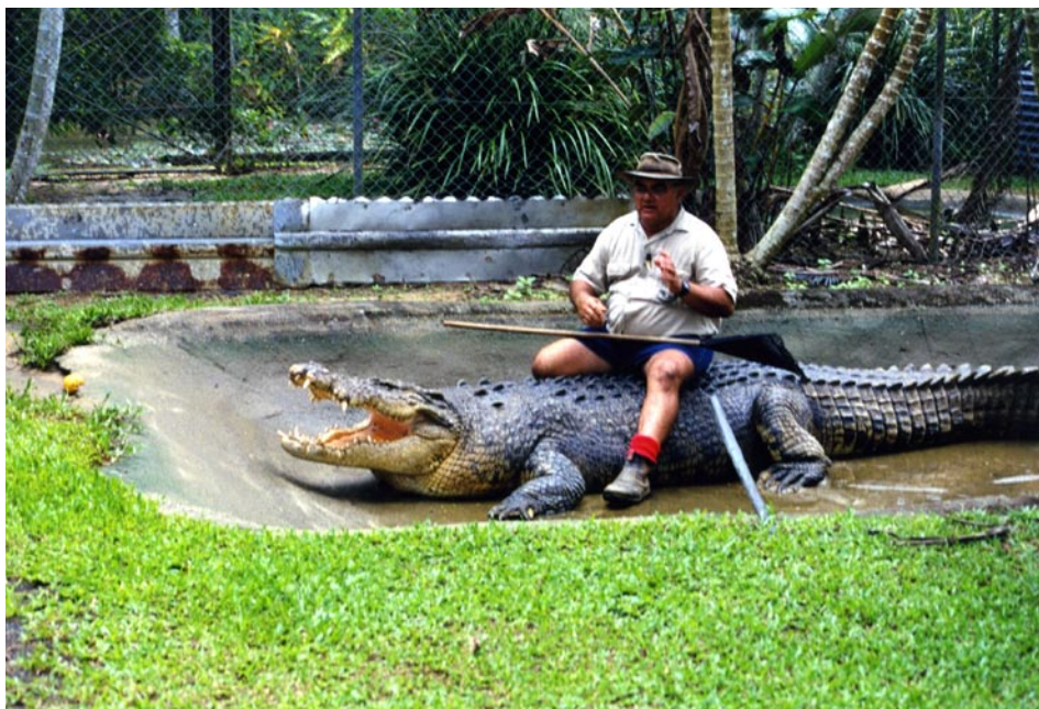
Besøg på krokodillefarm.

en enkelt tankstation. Vejen til Port Augusta var meget åben uden træer eller bakker. Dog så jeg en flok på ti motorcykler. Apropos flok. Der var emuer på vejen. De ser sjove ud, når de løber. Deres bagende hopper og danser. Til overnatning fandt jeg et kanon godt B&B, Wirrara Heritage, hvor jeg fik øller og aftensmad. Der var kun mig, bedsteforældrene, der styrede det hele, og deres barnebarn. Da jeg kom, frøs jeg. Kun ti grader udenfor. Indenfor var der kakkelovn og god varme.